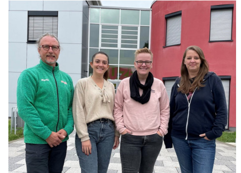
von links nach rechts