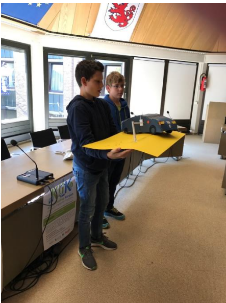
Solar betriebene Fahrzeuge und Ampeln