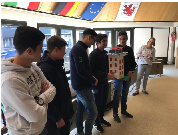
Zukunftshaus mit Eigenversorgung