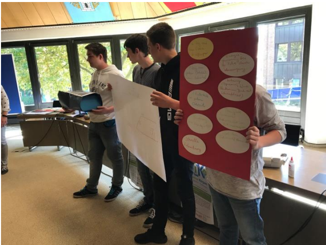
Schwebender Zug mit Solarantrieb